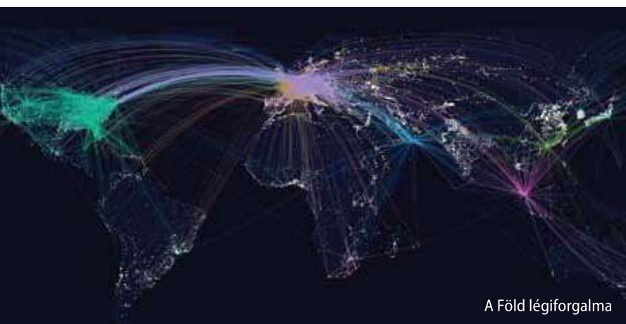
A Föld légiforgalma

tés során is felszaporodik ez a gomba. Maga a tünet alig észrevehető, enyhe megfázásszerű, azonban a lakosságnak akár a 90%-a is fertőzött lehet, és a gomba a szemben is fertőzéseket okozhat. Olyannyira, hogy az ocularis histoplasmosis Amerikában a vakság egyik fő okozója 12 .