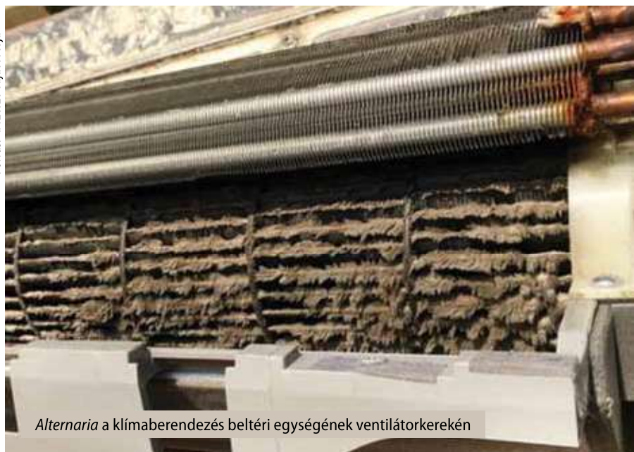
Alternaria a klímaberendezés beltéri egységének ventilátorkerekén

Többféle klímaszcenárió van, ami előrejelzi, hogy optimista illetve pesszimista forgatókönyvek szerint milyen éghajlati változásokra számíthatunk 20 . Azokat a gombákat, amelyeket részben behurcoltak, részben pedig már Magyarországon